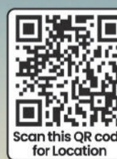
Scan this QR code for Location

Site Address: Near R.T.O Office, Beside Govt. College of Nursing Chilhati, Bilaspur (C.G.)