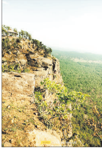
अलावा कई पर्यटन स्थल भी हैं जो अपनी पहचान की बारी का इंतजार कर रहे हैं। ऐसे

कोरिया जिले में स्थित राष्ट्रीय उद्यान को गुरु घासीदास तमोर पिंगला टाईगर रिजर्व क्षेत्र क्षेत्रफल की दृष्टि से देश का तीसरा सबसे बड़ा टाईगर रिजर्व क्षेत्र बन गया, इससे इसकी पहचान देशभर में हो गई है, इसके अलावा कोरिया जिले में कई अन्य पर्यटन स्थल हैं, यहां तक पहुंचने के लिए अब तक बुनियादी सुविधाएं ही विकसित नहीं की गई हैं। जिले में कई धार्मिक व ऐतिहासिक महत्व के स्थलों के