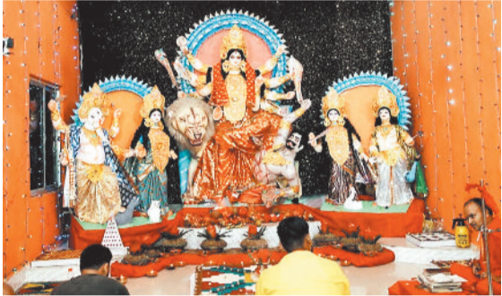
महादेव चौक सोनहत में विराजी मां दुर्गा।