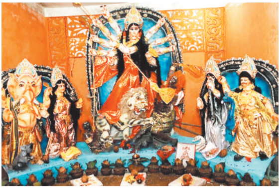
सोनहत के कचडांड में विराजी मां दुर्गा।