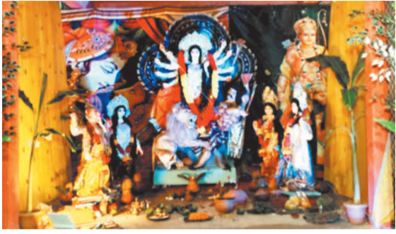
सोनहत के दामुज में विराजी मां दुर्गा।