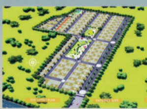
SITE LAYOUT PLAN