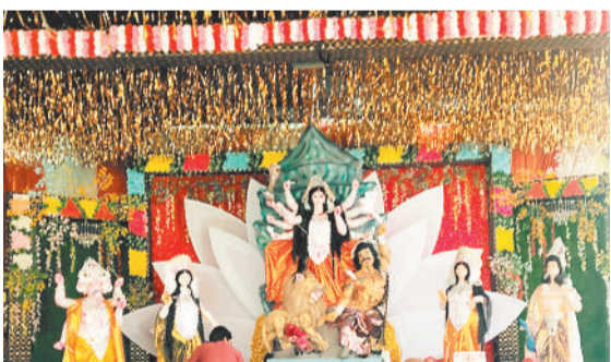
एमसीबी जिले के ग्राप उजियारपुर में विराजी मां दुर्गा।