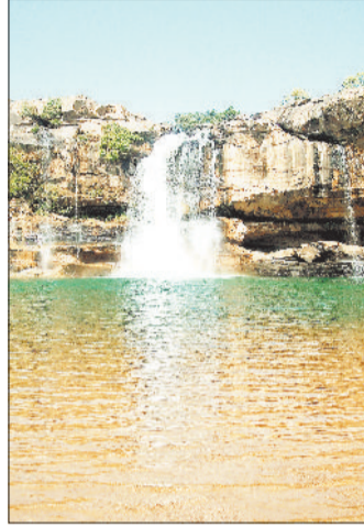
जगहों पर सुगम सड़क मार्ग बना दिए जाए तो पर्यटकों की संख्या बढ़ेगी साथ ही