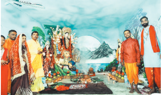
सोनहत के बुद्वार में विराजी मां दुर्गा।