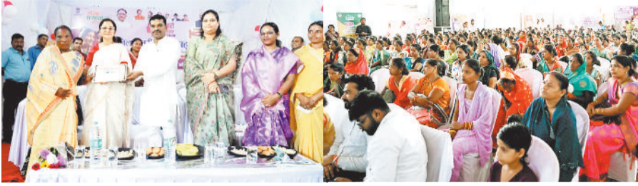
मानस भवन में आयोजित सम्मेलन।