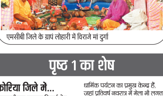
एमसीबी जिले के ग्राप लोहारी में विराजे मां दुर्गा