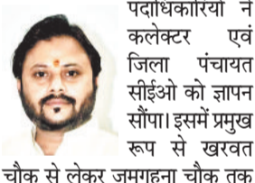
चौक से लेकर जगगहना चौक तक सड़क के दोनों ओर मुख्य मार्ग में समुचित प्रकाश व्यवस्था की मांग की, जिससे कि जिला मुख्यालय प्रवेश करने पर होने वाली दुर्घटनाओं को भी रोका जा सकेगा।

रखते हुए मुख्यालय की गरिमानुरूप विकास की मांग को लेकर चेंबर पदाधिकारियों ने कलेक्टर एवं जिला पंचायत सीईओ को ज्ञापन सौंपा। इसमें प्रमुख रूप से खरवत चौक से लेकर जगगहना चौक तक सड़क के दोनों ओर मुख्य मार्ग में समुचित प्रकाश व्यवस्था की मांग की, जिससे कि जिला मुख्यालय प्रवेश करने पर होने वाली दुर्घटनाओं को भी रोका जा सकेगा।