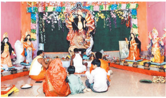
सोनहत के केशगवां में विराजी मां दुर्गा।