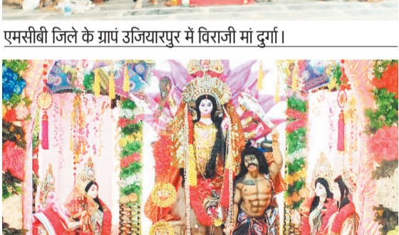
एमसीबी जिले के ग्राप लोहारी में विराजे मां दुर्गा