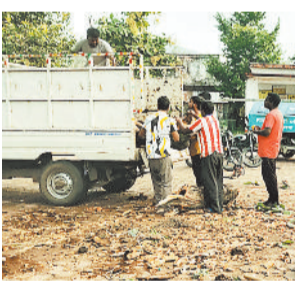
सवाल उठाया कि यदि पेड़ कक्षाओं की ओर गिरता तो बड़ा हादसा हो सकता था। सूचना देने के बावजूद नगर पालिका कर्मचारियों के समय पर नहीं पहुंचने से नाराजगी और बढ़ी। प्रशासन की लापरवाही को लेकर शिक्षक, छात्र और

चरचा कॉलरी। शासकीय हाई स्कूल चरचा कॉलरी में गुरुवार को उस समय बड़ा हादसा टल गया, जब परिसर में खड़ा एक विशाल महुआ का पेड़ अचानक गिर पड़ा। घटना के समय विद्यालय में सैकड़ों छात्र-छात्राएँ कक्षाओं में मौजूद थे। पेड़ की भारी डगाल जमीन पर गिरते ही अफरा-तफरी मच गई, लेकिन सौभाग्य से किसी तरह की जनहानि नहीं हुई। घटना के बाद छात्र-छात्राओं और अभिभावकों ने गहरी चिंता जताई। उन्होंने कहा कि परिसर में कई पुराने और जर्जर पेड़ खड़े हैं, जिन पर समय रहते ध्यान देना आवश्यक है। अभिभावकों ने