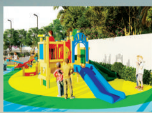
KIDS PLAY AREA