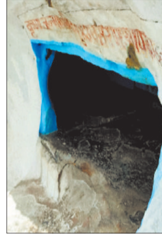
स्थानीय लोगों को रोजगार का अवसर भी मिल सकेगा। जिला प्रशासन को जिले के